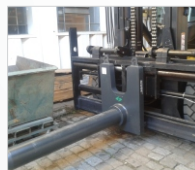
Bronce superior a 200°C

Revestimientos específicos en el espolón y en el cuerpo para cargas delicadas.