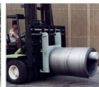
Nylon Plus Blue hasta 200°C