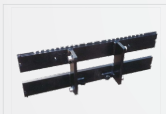
Enganche tipo ITA Integrado