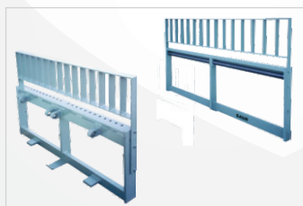
Enganche tipo Pin Superpuesto