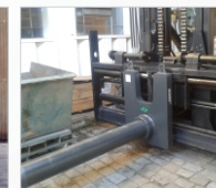
Celeron até 120°C