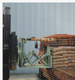
El movimiento de la carga es cero. En la medida que la placa empujadora avanza, la montacargas retrocede, tirando las horquillas debajo de la carga y depositándola sobre la carrocería del camión.