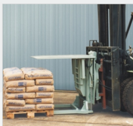
Con 2 horquillas estrechas, el Inversor agarra la carga

Nota: Los pesos mencionados son de los Inversores. Es necesario tener en cuenta la carga y el Inversor para determinar la capacidad de la montacargas. Para las capacidades indicadas, la presión máxima de trabajo es de 150 kg/cm². Con desplazamiento integrado, son necesarias 4 funciones hidráulicas.