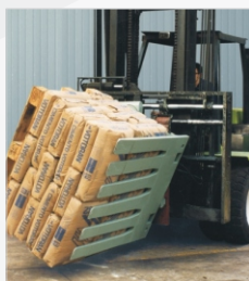
Comprime y gira la carga.