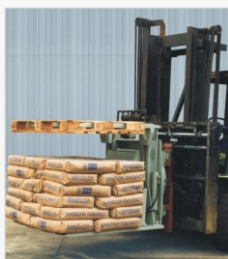
Se abre el Inversor alejando el pallet de la carga, dejándola sobre las 6 horquillas.