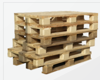
Con el Inversor Empujador de Carga se retienen los pallets en la empresa, los cuales es posible reutilizárselos.